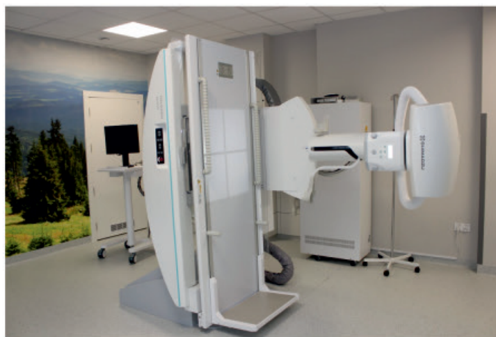
Nowoczesny aparat RTG - rok produkcji 2022

W roku 2022 zakończono ogromną, wartą ponad 7 mln zł inwestycję termomodernizacji budynków szpitala oraz instalacji paneli fotowoltaicznych, co już daje bezpośrednie przełożenie na oszczędności dla szpitala, przy jednoczesnym ograniczeniu niekorzystnego wpływu organizacji na środowisko naturalne poprzez zwiększenie efektywności energetycznej budynków Szpitala oraz efektywne wykorzystanie odnawialnych źródeł energii. To z kolei wpływa